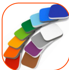
Elementy z kolorowego trójwarstwowego polietylenu hdpe o grubości 15 mm