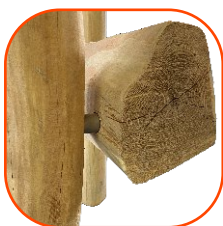
Naturalne drewno robinii akacjowej