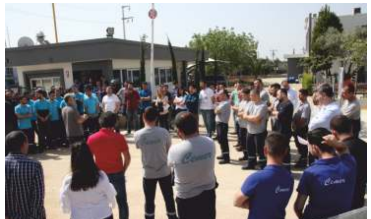
Cemer A.Ş.'tarafından çalışanlarının güvenliği için her yıl düzenlenen ve Şimşekler Yangın tarafından verilen 2018 Yangın eğitimi ve tatbikatından kareler.

Elbette oyunun bir süresi olması gerekir. Bunun için çizelgesini ilk tamamlayan oyuncu "bitti" dedikten sonra oyun başlangıcında belirlenen sayıya kadar sayılır. Daha sonra oyuncular her başlığa yazdıkları kelimeleri karşılaştırırlar. Her başlık kendi içinde puanlandırılır. Yazılamayan ya da yanlış - geçersiz yazılan kelimeler sıfır puan, doğru kazılanlar 10 puan ile derecelendirilir. Birden fazla oyuncu aynı cevabı yazmış ise puan bu oyuncular arasında paylaşılır. Oyun sonunda en çok puanı alan oyuncu kazanır.