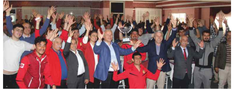
Metropolis otelde şampiyonluk kutlaması.

Takımın süper ligden de kupayla döneceğine inandığını belirten Eroğlu, özellikle bölgedeki iş adamlarının takımdaki oyuncularını engelli kadrolarında istihdam ederek takıma ve futbolculara destek verebileceğine vurgu yaptı ve iş adamlarını takıma sahip çıkmaya çağırdı.