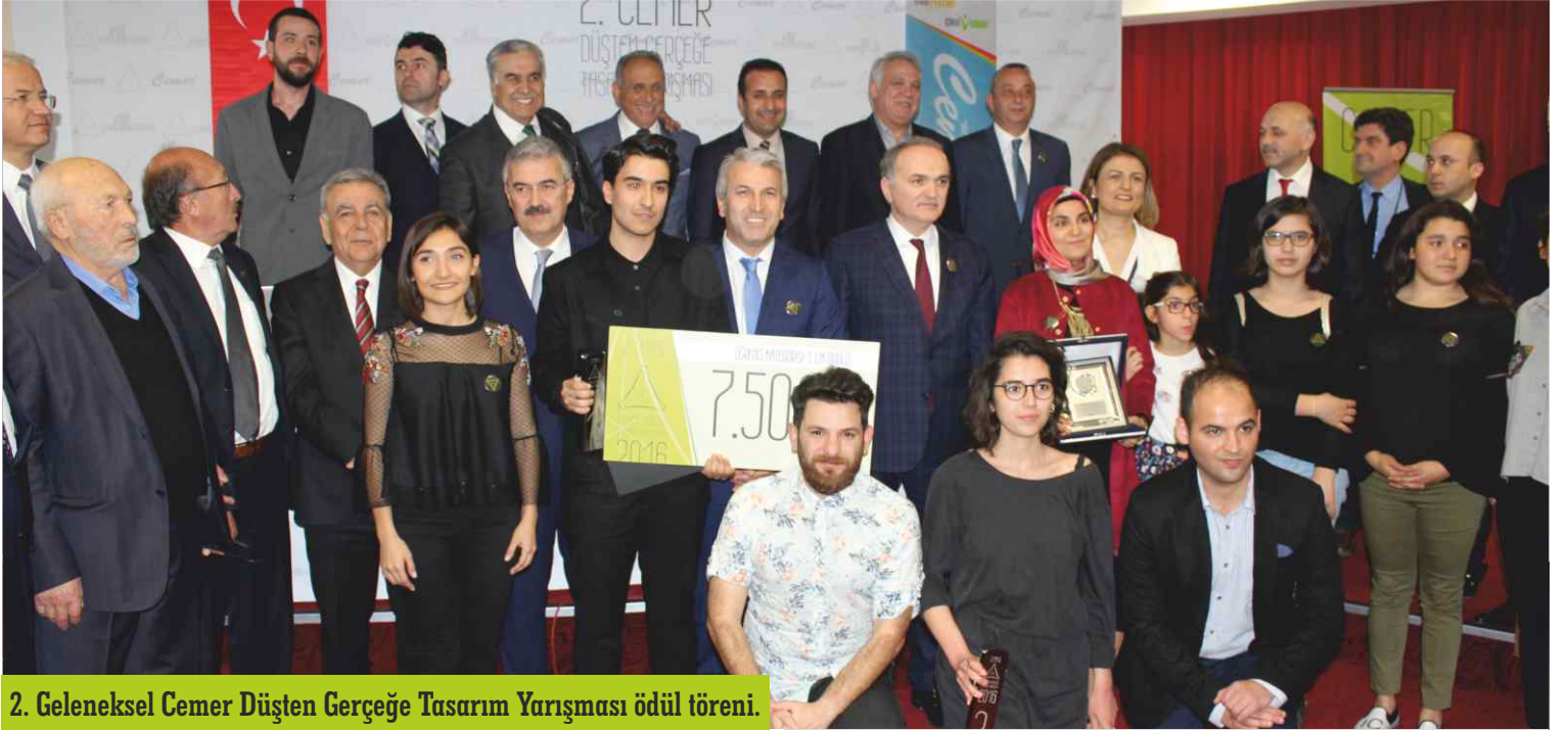
2. Geleneksel Cemer Düşten Gerçeğe Tasarım Yarışması ödül töreni.

● "2. Geleneksel Cemer Düşten Gerçeğe Tasarım Yarışması" ödül töreninde, 'geleceğin oyun parkı düşlerini gerçeğe dönüştürmek için yarışanlar' ödülleri kavuştu.