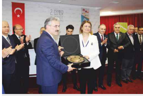
İzmir Valisi Erol Ayyıldız