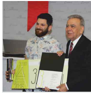
Öğrenci kategorisi 3.lük ödülünü İzmir Bş. Belediye Başkanı Aziz Kocaoğlu verdi.