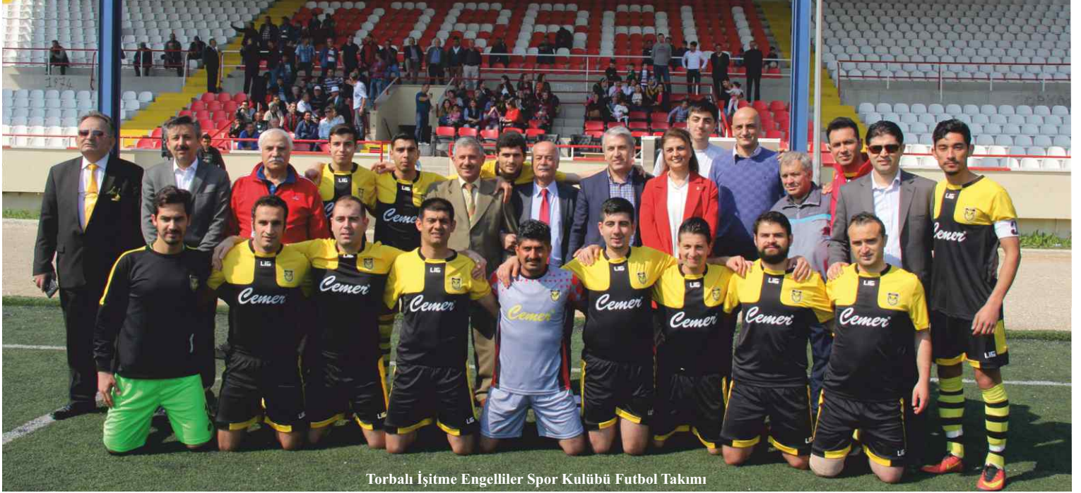
Torbalı İşitme Engelliler Spor Kulübü Futbol Takımı