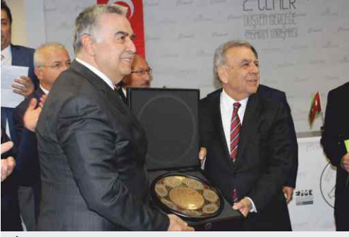
İzmir Büyükşehir Belediye Başkanı Aziz Kocaoğlu