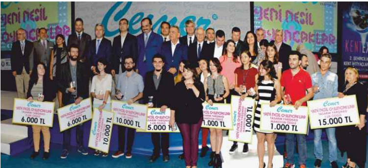
1. Cemer Düşten Gerçeğe Tasarım Yarışması ödül töreni.