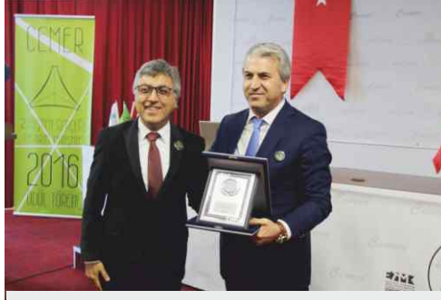
ETMK. Genel Başkanı Sertaç Ersayın.