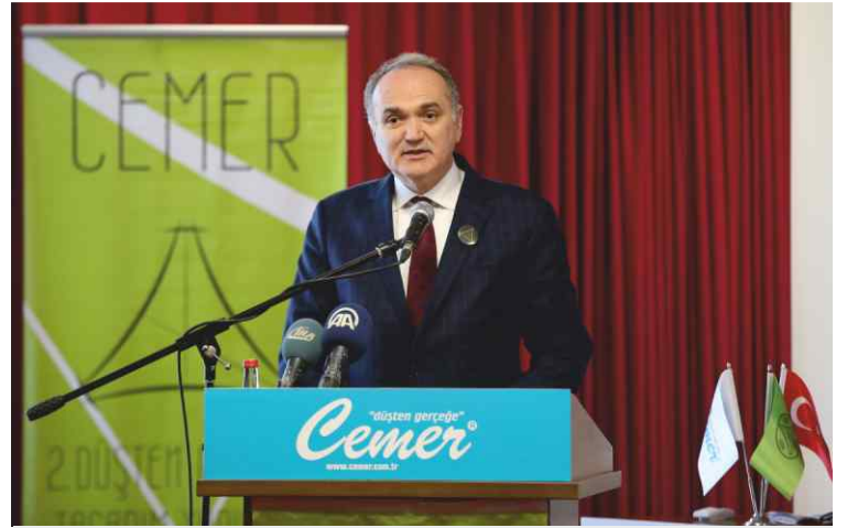
Bilim, Sanayi ve Teknoloji Bakanı Dr. Faruk Özlü

İzmir valisi Erol Ayyıldız ise teknoloji ve bilimde ilerleyen Türkiye'nin sahip olduğu kaynakları öne çıkararak farklılık oluşturmasının, ancak yenilik ve tasarım ile mümkün olabileceğine dikkat çekti. Vali Ayyıldız; “Bu tür organizasyonların, ilimizdeki yenilikçi tasarım kültürünün gelişmesi için önemli bir fırsat olduğunu ve farkındalığın daha geniş kitlelere yayılması noktasında yararlı olacağını düşünüyoruz” dedi.