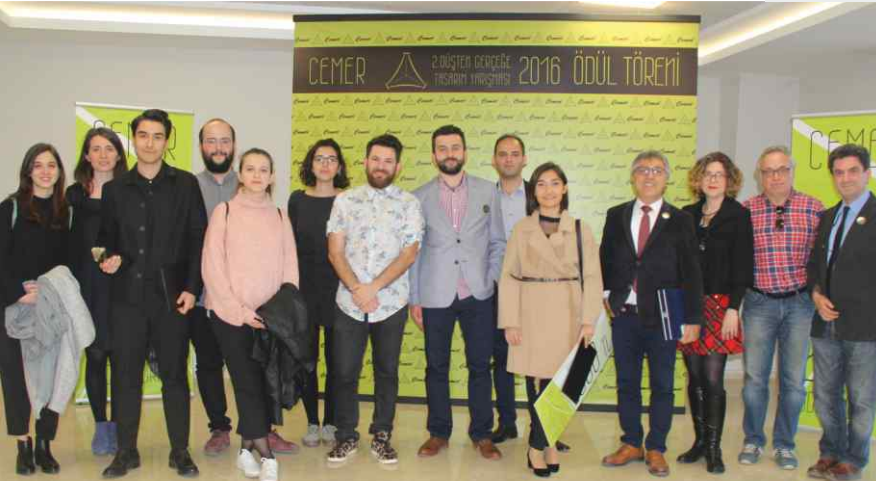
Yarışmacılar ve jüri üyeleri