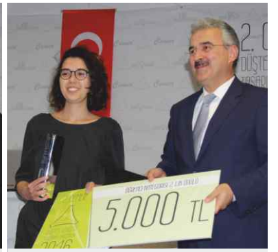
Öğrenci kategorisi 2. lik ödülünü İzmir Valisi Erol Ayyıldız verdi.