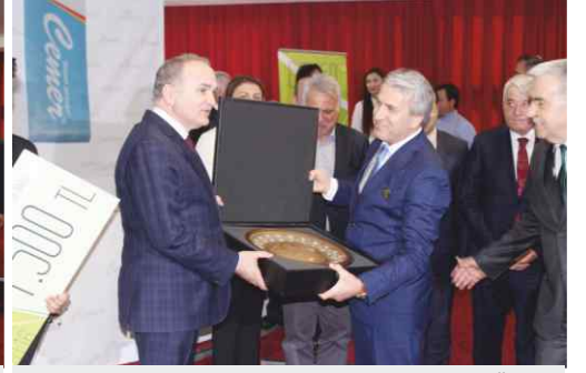
Bilim, Sanayi ve Teknoloji Bakanı Dr. Faruk Özlü

Temennimiz, bu yarışmayı, 2018 yılında uluslararası platforma taşımaktır. Çünkü tasarım dünyasını desteklemek, ülkenin geleceğini desteklemektir diye düşünüyoruz.” dedi.