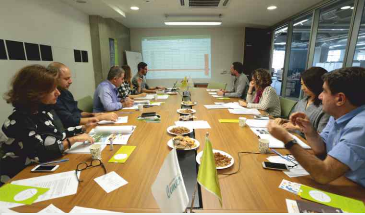
2. Geleneksel Cemer Düşten Gerçeğe Tasarım Yarışması jürisi, projeleri değerlendiriyor.

Çocuk düşlerini gerçekleştirmek amacıyla çıktıkları yolda “düşten gerçeğe” sloganının yarışma adları olduğunu belirten Eroğlu, “2016 yılında ikincisini düzenlediğimiz yarışmanın konusunu “geleceğin oyun parkı” olarak belirledik.