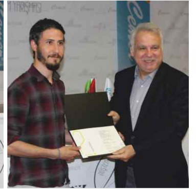
Profesyonel kategorisi 2. lik Ödülünü İzmir Milletvekili Hüseyin Kocabıyık verdi.