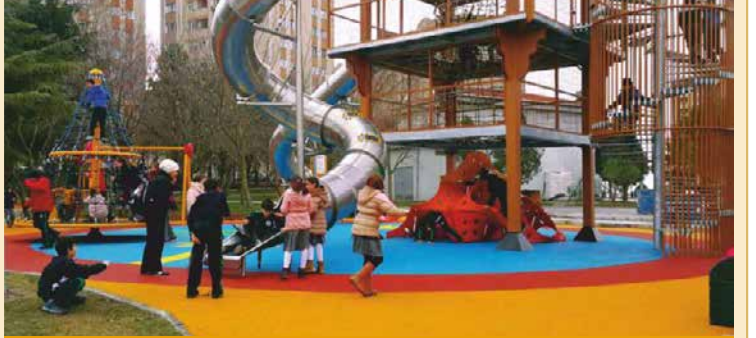
İstanbul Küçükçekmece'deki oyun parkı alışılmışın dışındaki oyun grupları ile dikkat çekiyor .

İstanbul Küçükçekmece'de farklı oyun grupları ile dikkat çeken oyun parkını çocuklar çok sevdi. Parkın günün neredeyse her saati dolu olduğunu ve çocukların parktan ayrılmak istemediklerini belirten bir veli, "Park her zaman cıvıl cıvıl. Havanın soğuk olmasına rağmen çocuklar parka gelmek ve oyuncakları kullanmak istiyorlar. Çok değişik ve yeni oyuncaklar var. Çocuklar sıkılmadan saatlerce oyun oynayabiliyorlar. Parkta kullanılan oyuncakların kalitesini ve çocuklarımız için güvenli olduğu gördükten sonra çocuklarımızı parka oynamaya gönderirken bizim de içimiz rahat" dedi.