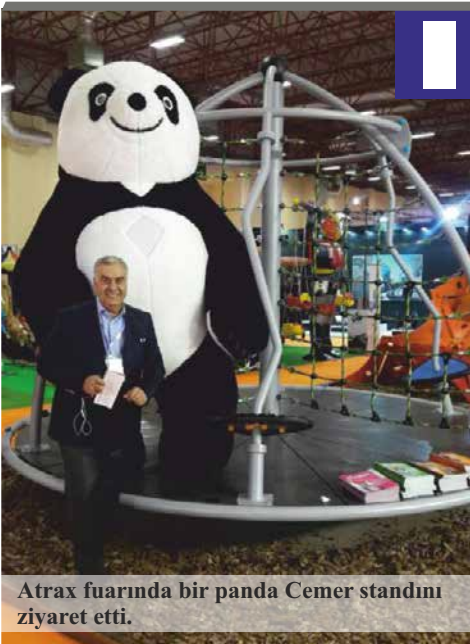
Atrax fuarında bir panda Cemer standını ziyaret etti.