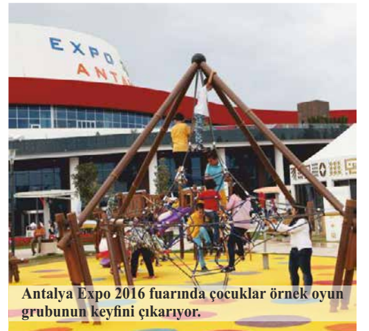
Antalya Expo 2016 fuarında çocuklar örnek oyun grubunun keyfini çıkarıyor.

Katıldığı fuarlarda yeni nesil ve elektronik oyun gruplarından örnekler sunan Cemer standlarının her yaştan ziyaretçileri, fuar alanlarında kurulmuş oyun gruplarının keyfini doyasıya çıkardı.