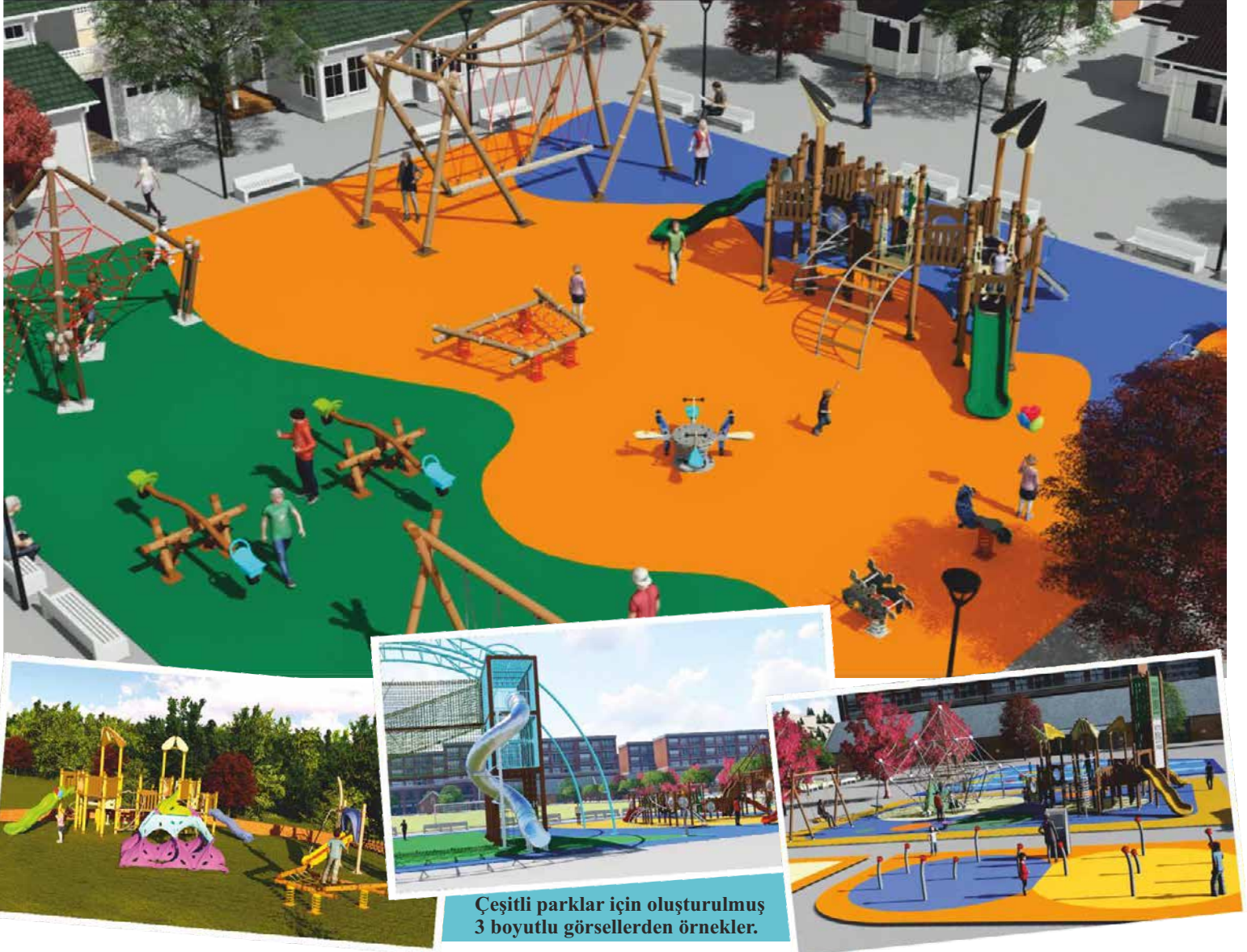
Çeşitli parklar için oluşturulmuş 3 boyutlu görsellerden örnekler.

● Cemer'den proje istediğinizde projenizin 3 boyutlu animasyon videosunu da isteyebilirsiniz. Cemer, bünyesindeki Proje -Tasarım birimiyle, oyun parkı projelerini 3 boyutlu olarak canlandırıyor ve sizi projenizin içerisinde sanal bir tura çıkarıyor.