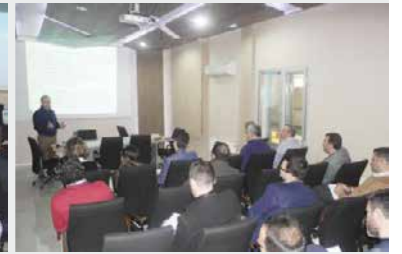
Cemer A.Ş. yılsonu toplantılarından kareler.

2017 yılı, Cemer A.Ş. için Ar-Ge ve inovasyon çalışmalarının daha da ivme kazanacağı ve hedeflerine kararlılıkla ilerlemeyi sürdüreceği bir yıl olacak.