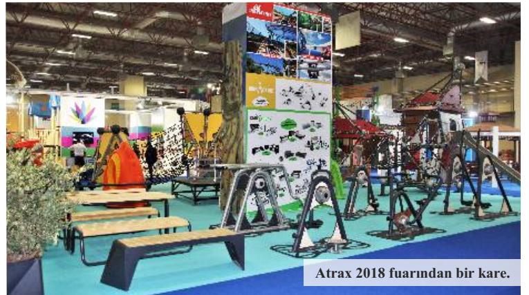
Atrax 2018 fuarından bir kare.

Oyunun başka bir versiyonunda ise topu tutamayan ve ebe olan oyuncu bir renk söyler. Oyuncular çevrelerinde bu renkte bir eşya bulmaya çalışırlar. Ebenin söylediği renkteki eşyaya dokunan oyuncu korunmuş olur. Ebe istop dediğinde rengi bulamamış olan oyuncu olduğu yerde kalır ve ebe olan oyuncu, topla diğer oyunculardan renk bulamayanları vurmaya çalışır. Bir oyuncu vurulana ya da ebe pes edip oyun dışı kalana kadar böyle devam eder. Bir oyuncu oyun dışı kaldığında ya da herkes söylenen rengi bulabildiyse kalan oyuncular tekrar bir daire oluştururlar ve oyun aynı şekilde devam eder.