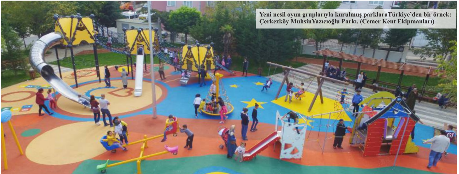
Yeni nesil oyun gruplarıyla kurulmuş parklara Türkiye'den bir örnek: Çerkezköy Muhsin Yazıcıoğlu Parkı.

Sanayi Devrimiyle birlikte kentsel nüfusun artmasıyla, yoksul semtlerdeki evsiz çocuk sayısı ve dolayısıyla çocukların işledikleri suç oranlarında da artış olmuştur. "Child Saver" olarak bilinen aktivistlerin sokakta kalan ve oynayabilecekleri bir alana sahip olmayan