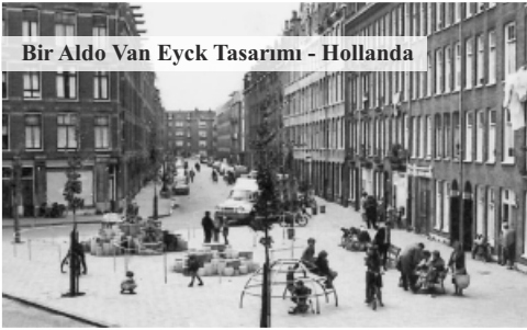
Bir Aldo Van Eyck Tasarımı - Hollanda

Amsterdam Kentsel Gelişim Departmanı, savaşın yaralarını örtmek için her mahallede en az bir çocuk oyun alanı üretmeye karar verir. Bu projenin başına getirilen Hollandalı mimar Aldo van Eyck 1947 ile 1978 yılları arasında yaklaşık 730 adet, günümüzde çok azı ayakta kalan çocuk oyun alanları ile kenti donatır.