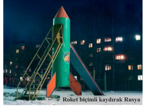
Roket biçimli kaydırak Rusya

gibi, hayal gücünü ve fantazi dünyasını geliştirmeye yönelik oyun parkları yapılmaya başladığı "Novelty Playground" dönemi başlar. Hem 2. Dünya Savaşı sonrası olması, hem uzay biliminde yaşanan gelişmeler gibi dönemin dinamikleri, oyun alanlarına da yansır.