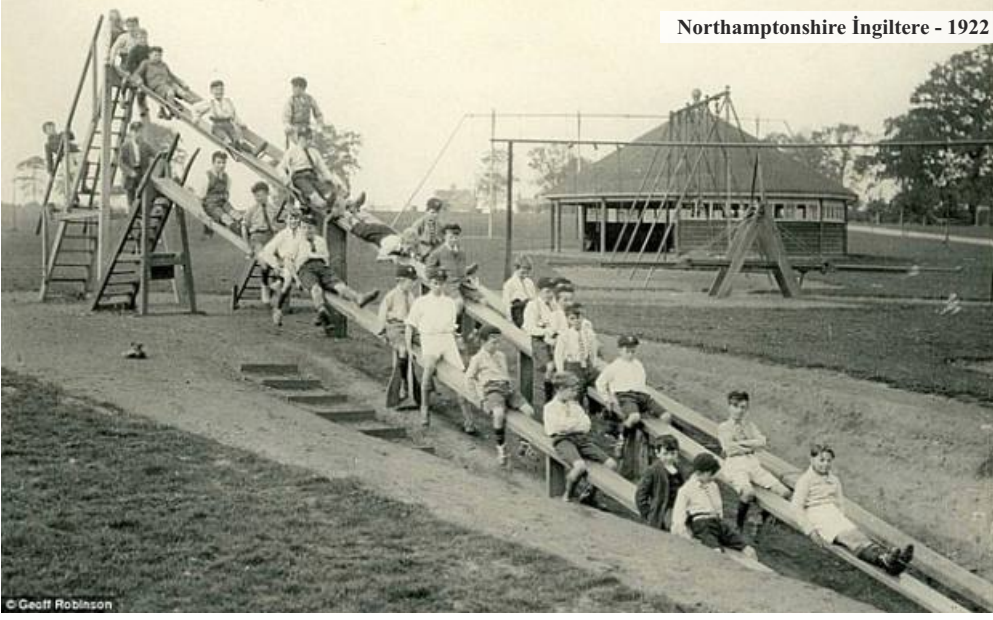
Northamptonshire İngiltere - 1922

binlerce çocuğu suçtan uzak tutmak için düşündükleri fikirlerden biri de güvenli oyun alanları sağlamak olmuştur. Berlin'deki kum bahçelerini görerek edindikleri bu fikri, 1886'da Boston'da uygulamaya başlamışlardır.