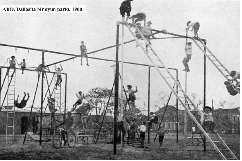
ABD. Dallas'ta bir oyun parkı, 1900

Bunlara ek olarak; Yeni nesil oyun gruplarının üretilmesi ve bu tip tasarımların yaygınlaşmasını sağlamaya yönelik, Türkiye'nin ilk ve tek oyun grubu tasarım yarışması olan ve bu yıl da uluslararası olarak gerçekleştirilecek " Cemer Düşten Gerçeğe Tasarım Yarışması " gibi çeşitli faaliyetler de yürütülmektedir.