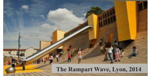
The Rampart Wave, Lyon, 2014

1970lere kadar süren oyun parklarında macera döneminden sonra çocukların güvenliğinden duyulan endişe nedeniyle, çoğunlukla plastikten yapılan malzemelerin kullanıldığı, çocukların hareketinin sınırlarının oyun mobilyalarıyla çizildiği standart oyun alanları üretilmeye başlanır.