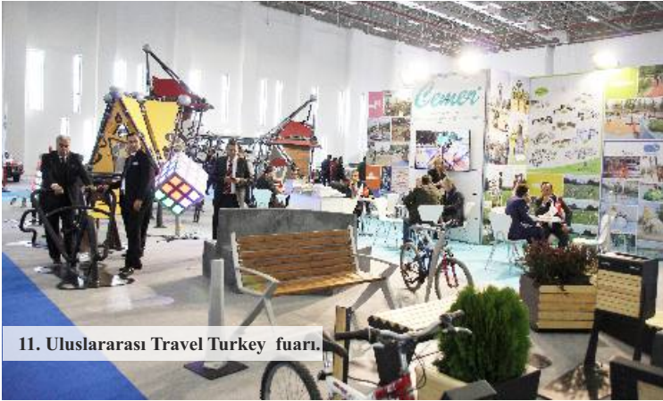
11. Uluslararası Travel Turkey fuarı.