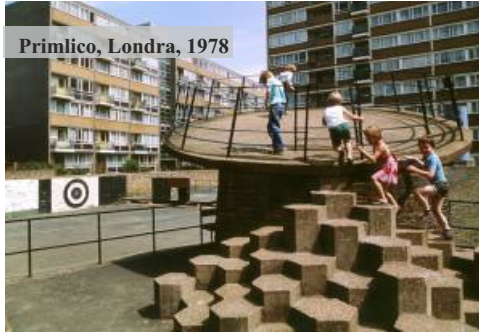
Primico, Londra, 1978

Amsterdam Kentsel Gelişim Departmanı, savaşın yaralarını örtmek için her mahallede en az bir çocuk oyun alanı üretmeye karar verir. Bu projenin başına getirilen Hollandalı mimar Aldo van Eyck 1947 ile 1978 yılları arasında yaklaşık 730 adet, günümüzde çok azı ayakta kalan çocuk oyun alanları ile kenti donatır.