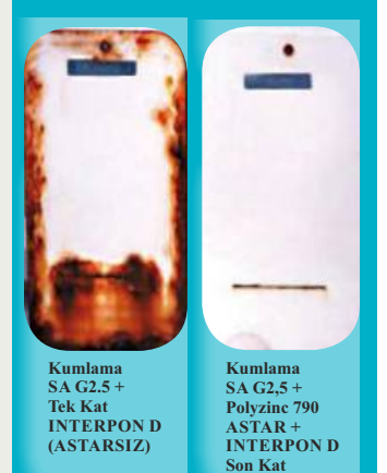
Kumlama SA G2.5 + Tek Kat INTERPON D (ASTARSIZ)