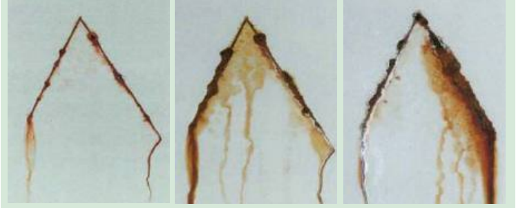
Yüksek Seviye Paslanma

kullanıcı yelpazesi tarafından onaylanmıştır.