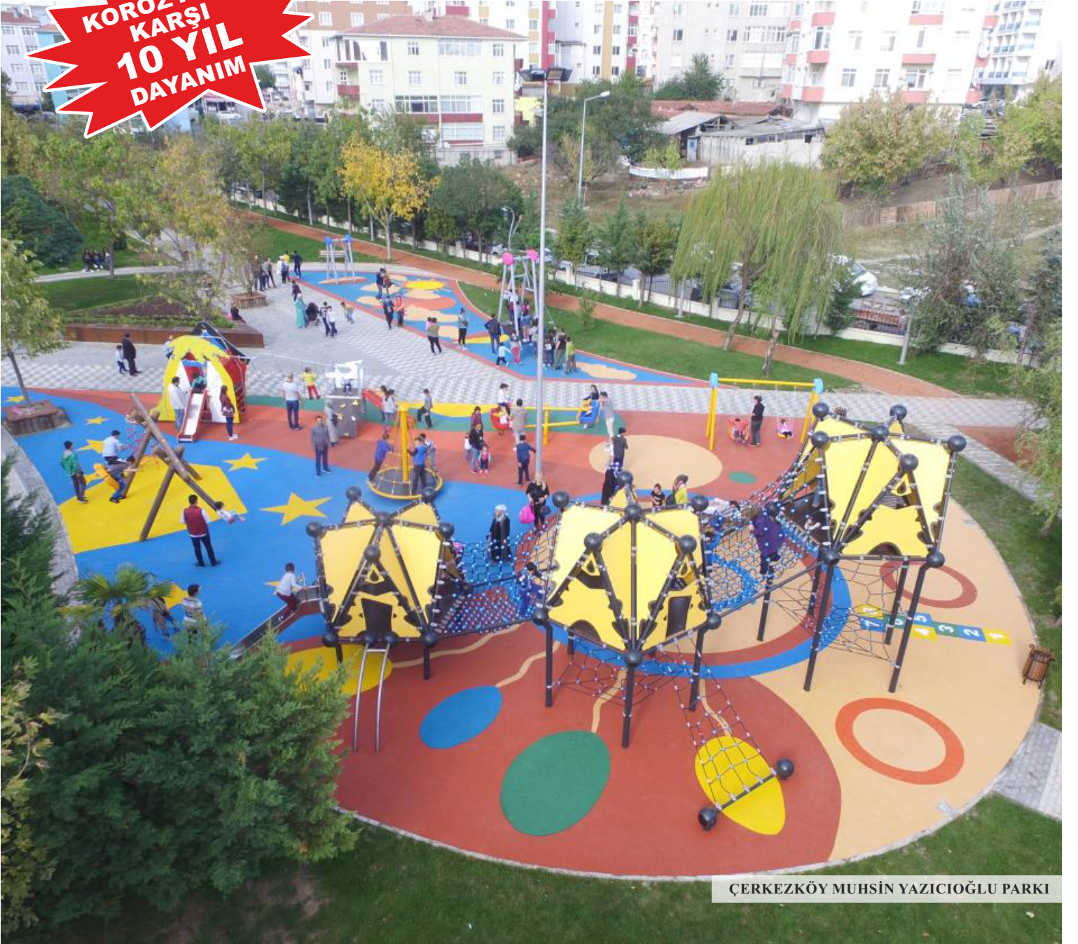
ÇERKEZKÖY MUHSİN YAZICIOĞLU PARKI