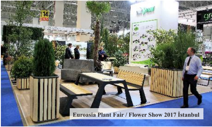
Euroasia Plant Fair / Flower Show 2017 İstanbul

Cemer Tasarım Merkezi'nde, Ankara'da düzenlenen 6. Özel Sektör Ar-Ge ve Tasarım Merkezleri Zirvesi'ne "Yeni Nesil Kent Ekipmanları" tasarımları ile katıldı.