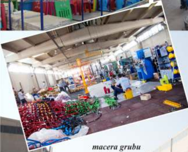
macera grubu fabrika binası