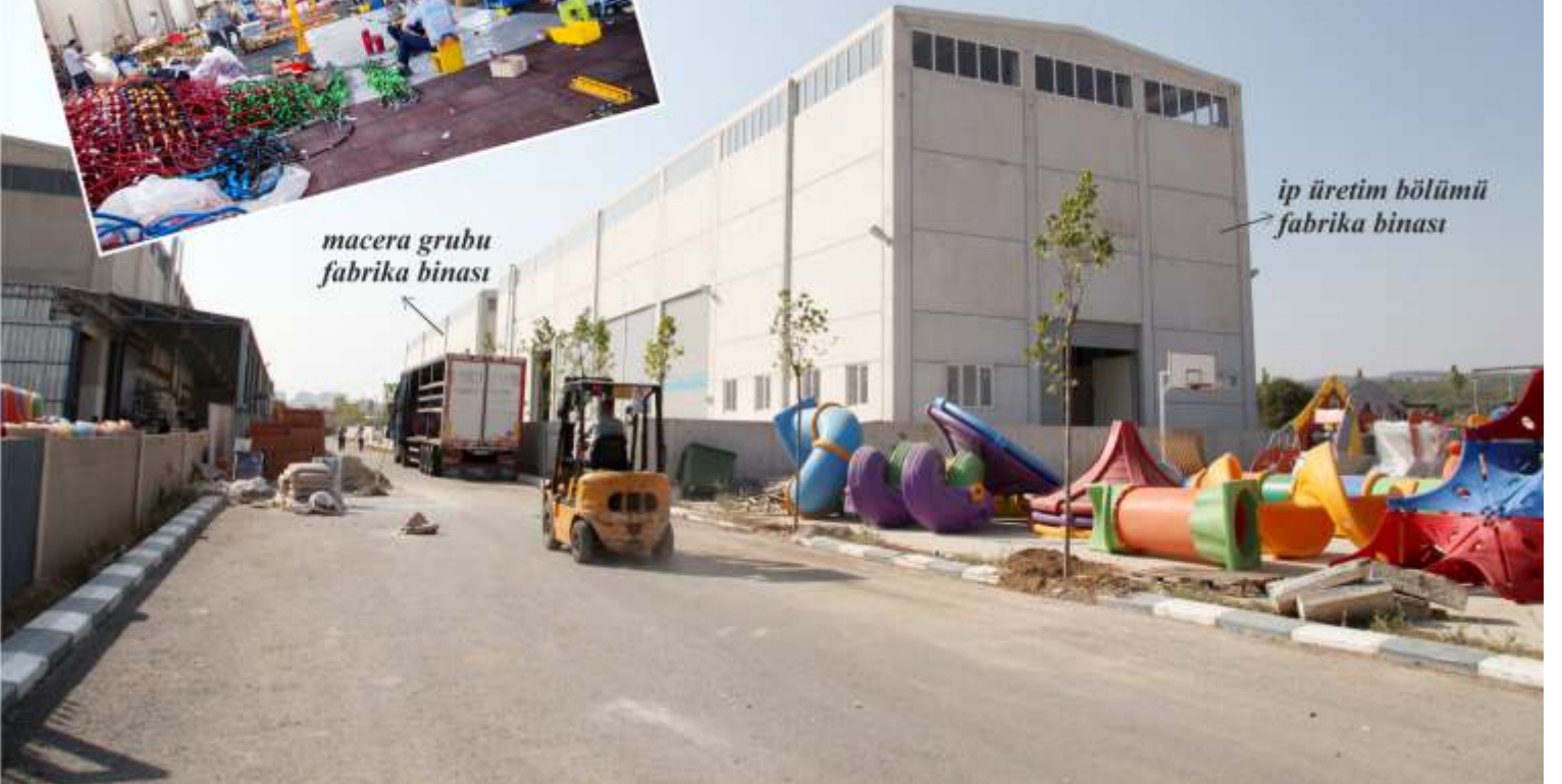
ip üretim bölümü fabrika binası